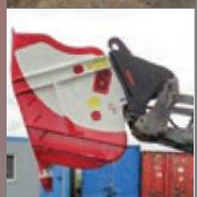
可安装在轮式装载机或伸缩臂上的装置